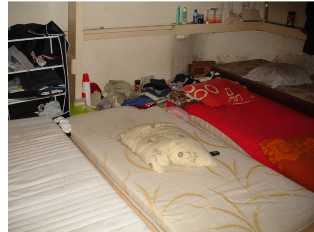
Illustratie 1. Aanwijzingen arbeidsuitbuiting

zorginstrumenten. Hier worden onderlinge afspraken over gemaakt.