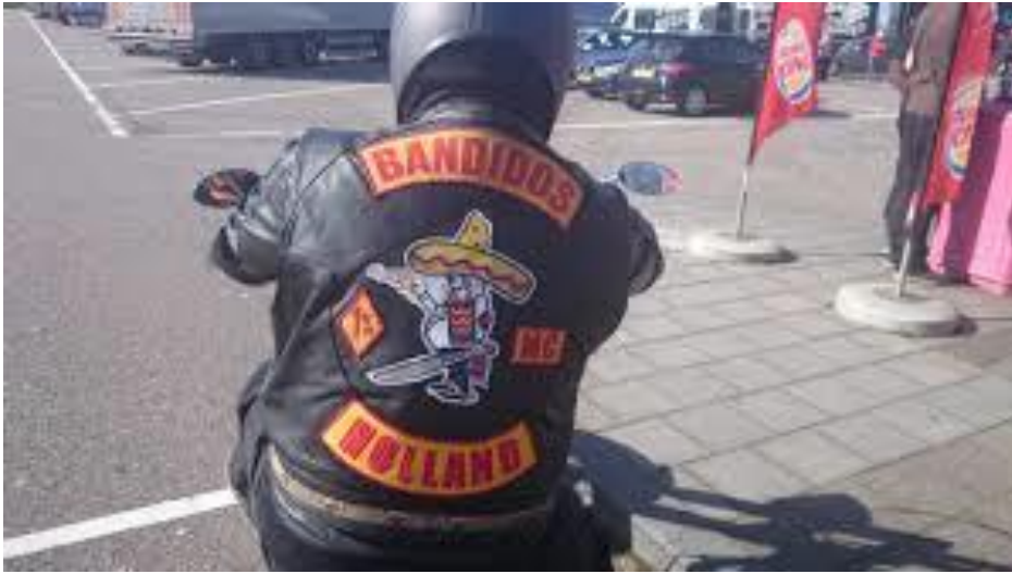
Colors Bandidos MC