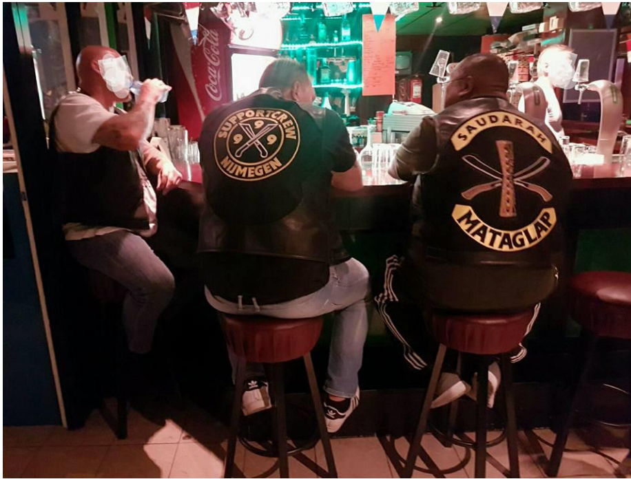
Colors supportcrew 999 en SAUDARAH