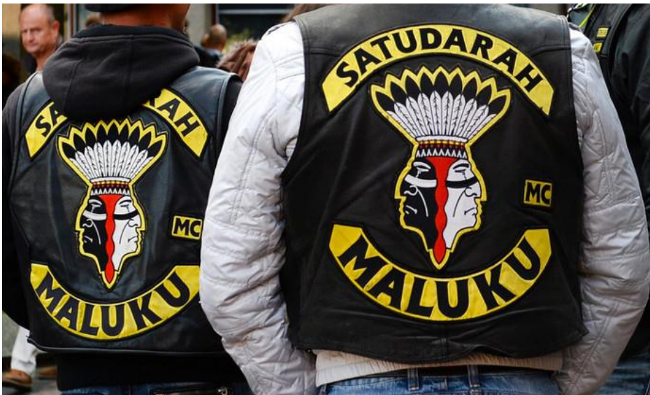
Colors Satudarah MC