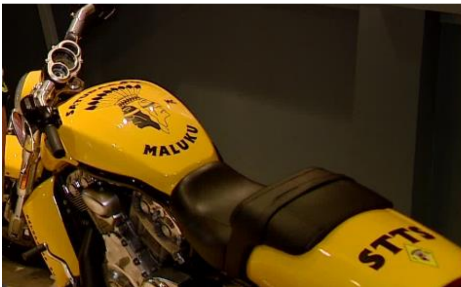
Motor voorzien van Satudarah MC bestickering