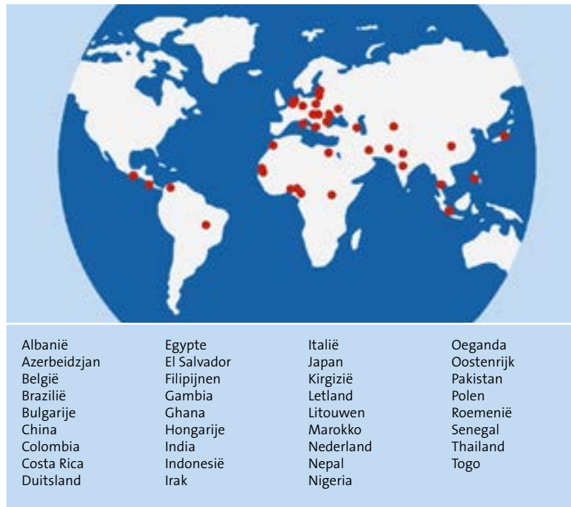
Figuur 2: Herkomst slachtoffers mensenhandel in hulpverlening bij SHOP 2016-2019 (bron: interne rapportages)

De grootste groep vermoedelijke slachtoffers in Den Haag en omgeving heeft de Nederlandse nationaliteit. Verder waren de slachtoffers in de periode 2016-2019 afkomstig uit meer dan dertig andere landen (zie onderstaand figuur 2). Ook landelijk zien we de laatste twintig jaar met meer dan honderd verschillende nationaliteiten een grote verscheidenheid in afkomst.